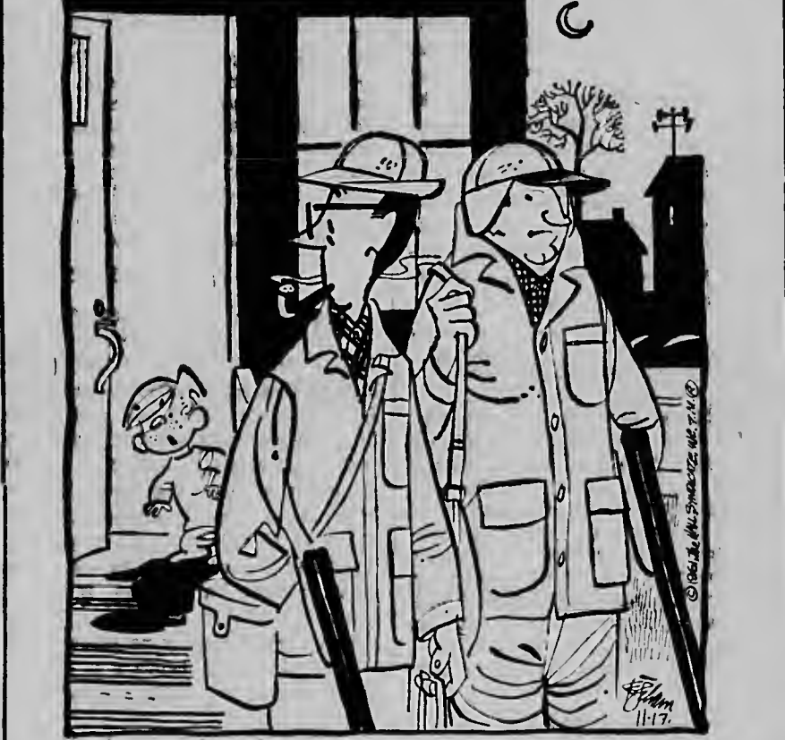
"Tende, ta intencion di bai forma un cuerpo di polis boso tin?"